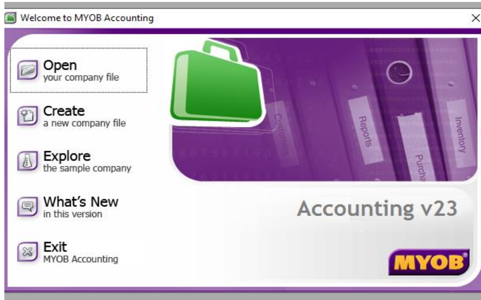
Gambar 1. Tampilan Awal Aplikasi MYOB Accounting

Disini bisa kita lihat tampilan awal pada saat kita akan mulai menggunakan MYOB Accounting dimana kita lihat ada 5 menu yaitu :