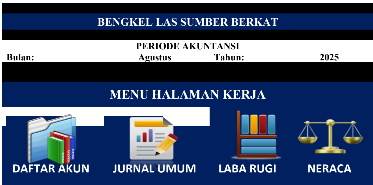
Tabel 1. Menu Utama

Tabel 1 menampilkan menu utama sistem informasi laporan keuangan pada Bengkel Las Sumber Berkat. Menu ini dirancang menggunakan Microsoft Excel sebagai pusat navigasi untuk mempermudah pengguna dalam mengakses berbagai fitur utama pelaporan keuangan. Pada bagian atas ditampilkan identitas usaha serta periode akuntansi, yaitu bulan Agustus tahun 2025, sebagai penanda waktu pelaporan. Bagian menu halaman kerja terdiri atas empat tombol utama yang mewakili komponen penting dalam siklus akuntansi, yaitu Daftar Akun, Jurnal Umum, Laba Rugi, dan Neraca. Menu Daftar Akun berisi kode dan nama akun yang digunakan dalam pencatatan transaksi keuangan, sedangkan Jurnal Umum digunakan untuk mencatat seluruh transaksi keuangan berdasarkan urutan kejadian. Selanjutnya, menu Laba Rugi menampilkan hasil perhitungan pendapatan dan beban usaha untuk mengetahui tingkat keuntungan atau kerugian, dan menu Neraca menyajikan posisi keuangan perusahaan dalam bentuk aset, kewajiban, dan modal pada akhir periode akuntansi. Dengan tampilan visual yang menarik dan sistem navigasi yang sederhana, menu utama ini mempermudah pengguna dalam mengelola, mencatat, serta menganalisis laporan keuangan secara cepat dan efisien.